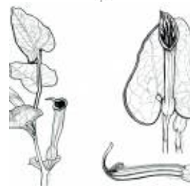
Afirmção 11 B