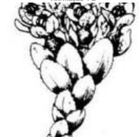
Afirmção 6 A