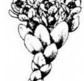
Afirmção 6 A