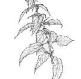
Afirmção 10 B