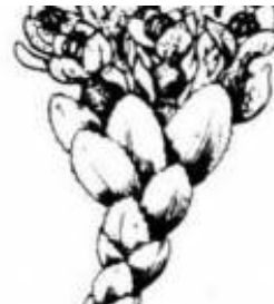
Afirmção 1 A