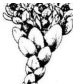
Afirmção 1 A