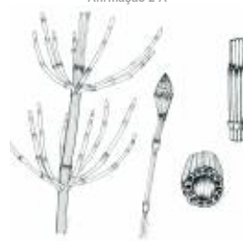
Afirmção 4 A