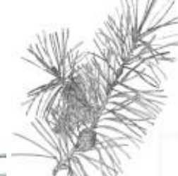
Afirmção 3 B