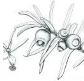
Afirmção 4 A