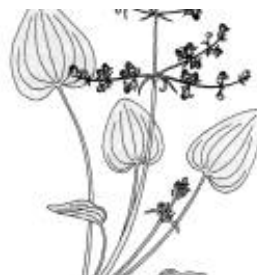
Afirmiação 8 B