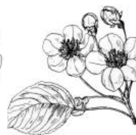
Afirmiação 8 B