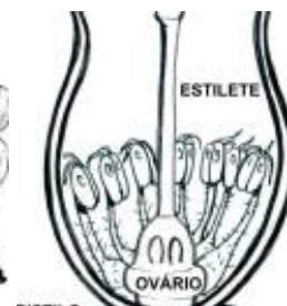
Afirmiação 9 B