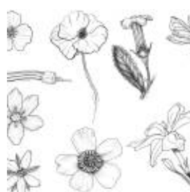
Afirmiação 10 B