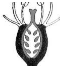
Afirmção 3 B