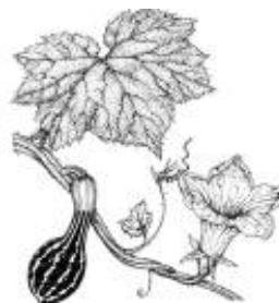
Afirmção 1 B