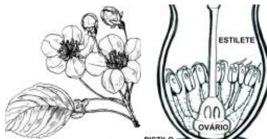
Afirmação 7 B