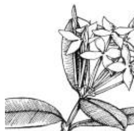
Afirmção 2 B